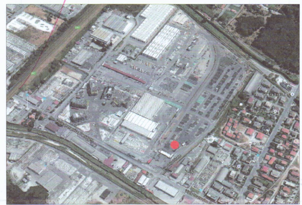
● Area d'intervento