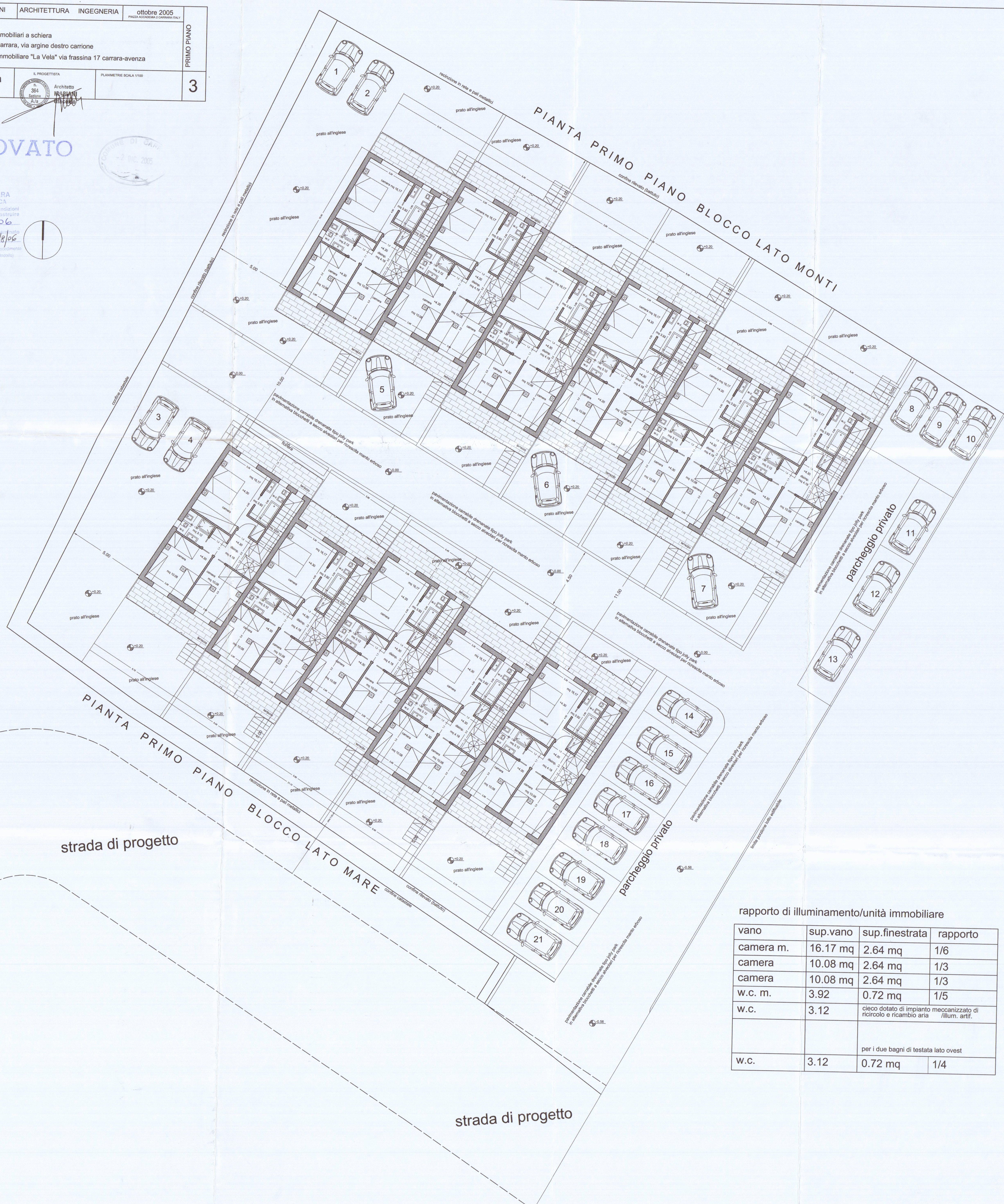
rapporto di illuminamento/unità immobiliare